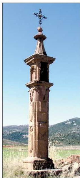
Peirón de Villar del Salz.