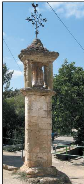
Peirón de San Antón, en la localidad de Lagueruela.

Sin duda el momento de mayor ímpetu constructivo lo constituyen los siglos XVIII y XIX, aunque constan noticias algunos levantados en épocas anteriores. En Lagueruela, Caminreal, Tornos, El Poyo del Cid, Navarrete o Villar del Salz se conservan algunos de los más artísticos, levantados en piedra. No siempre se recurrió a escultores para construirlos. Con frecuencia se recurrió al ladrillo con el que erigir un prisma, a veces enlucido con yeso, en el que se colocó una sencilla imagen del santo titular. Es el modelo más habitual.