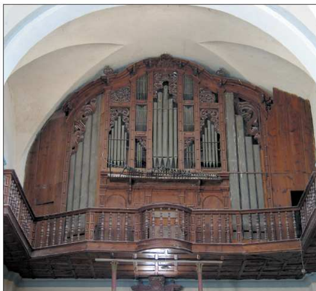
Órgano de Caminreal.