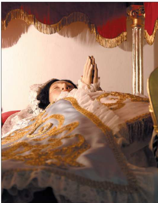
Peana de la Virgen bajo palio de Calamocha.

Con frecuencia en estos siglos se harán imágenes “de vestir”. Se trata de unos maniqués en los que únicamente la cabeza y las manos o pies están tallados. El resto es un armazón sobre el que se colocarán los vestidos y mantos. Al ser movidas durante la procesión darán cierta sensación de mayor realismo.