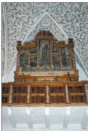
Órgano de Bañón.