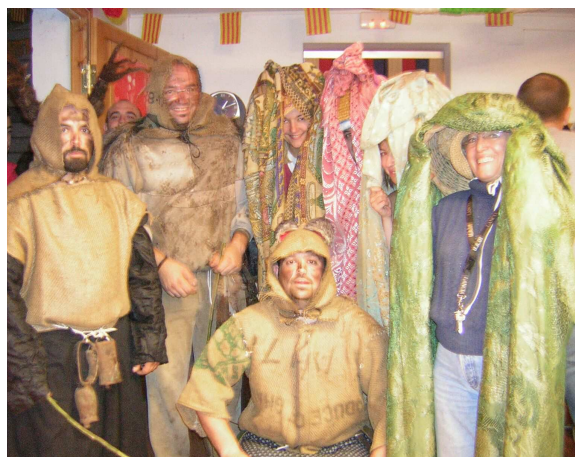
Vestimenta de referencia en el carnaval de Rubielos de la Cérída